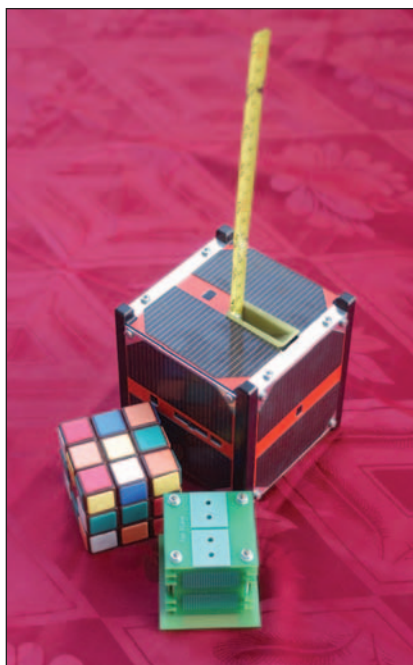
Kockák, magyar módra: Masat-1, Rubik és BME-1

Az Oscar-40-nel eljutottunk a csúcsra. Több mint fél tonna(!) súly, 600 W teljesítményű nap-elemek és saját pályakorrekciós hajtóművek. Az Ariane 5 rakéta startköltsége 4,5 millió USD volt. Start 2000-ben. A végeredmény: